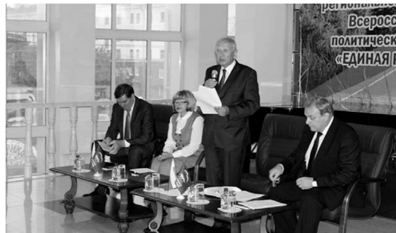
также проекты, имеющие определенную электоральную направленность в том или ином населенном пункте «Строительство ФО-