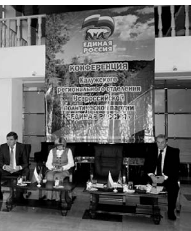
Ков», «России важен каждый ребенок» и другие».

По словам секретаря, «сегодня необходимо напрямую разговаривать с людьми, объяснять наши цели и задачи. Особое внимание уделять участию в работе общественных организаций, привлекать на свою сторону лидеров, самим выдвигать своих людей в управление общественными организациями и объединениями».