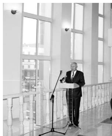
разования», «Детские сады – детям», направленные на прямое живое общение с населением, а

это необходимость качественной работы партийцев в рамках агитационно-пропагандистской работы: «С ростом политической конкуренции возрастает необходимость разработки новой концепции партийной агитационно-пропагандистской работы и медийного сопровождения. Партия должна работать во взаимодействии с различными слоями, группами и сегментами общества, при этом необходимо учитывать специфику городского и сельского жителя. Уже сейчас мы должны формировать взаимодействие с целевыми группами, в том числе в рамках реализации партийных проектов. Это и «Народный контроль», «Покупай калужское», «Управдом», «Модернизация об-