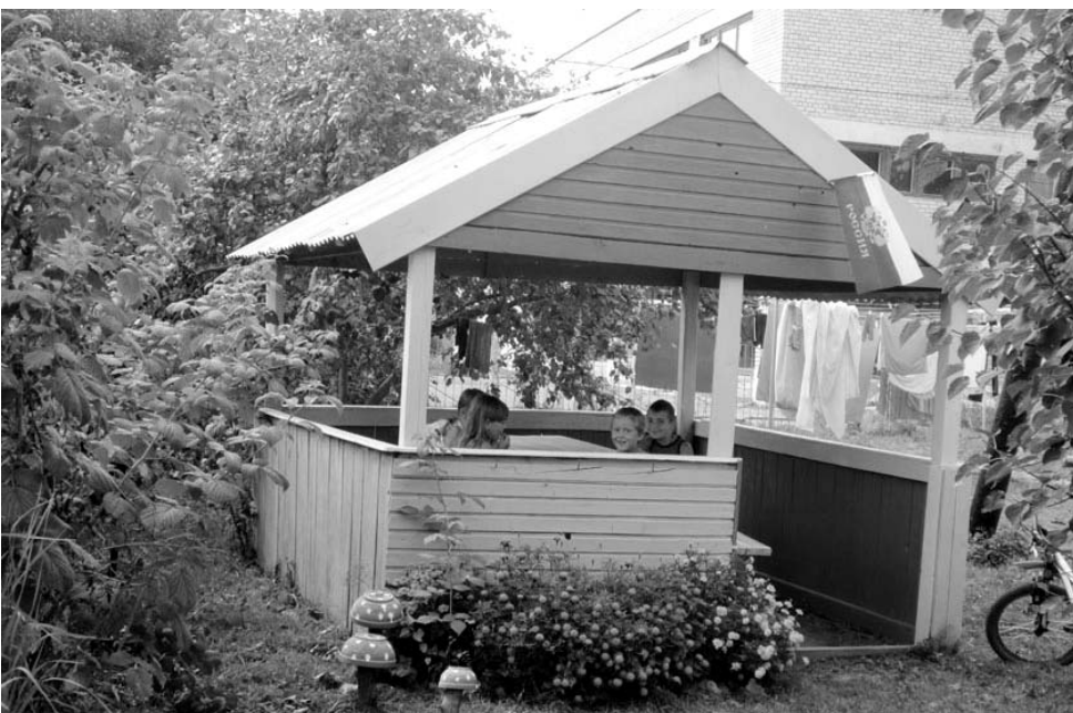
Беседка перед многоквартирным домом на ул. Анохина.