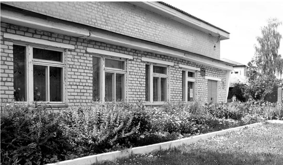
Территория районной библиотеки.